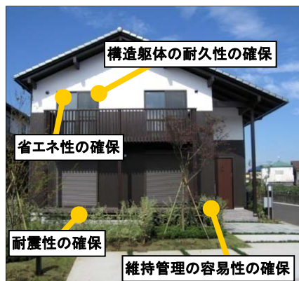
長期優良住宅のイメージ(木造戸建住宅)

長期優良住宅の認定基準等については、国土交通省ホームページ「長期優良住宅法関連情報」をご覧ください。